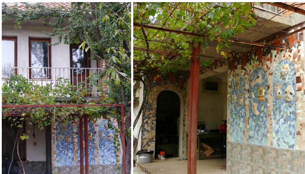
Фиг. 5, 6. Мозайката в екстериора на къщата

Врата със засводена горна част към пристройката, изградена до къщата, се превърна в художествен повод да се проектират три арки, които да формират архитектурен ордер във фасадата на долния етаж. Така се създаде оптичка илюзия за отворени през арките пространства, в които маските се вписаха по органичен начин. Фонът около тях се реши в синьозелената гама, която направи добър контраст както със самите маски, така с и изпълнените в охра арки. Горната част на мозайката се свърза с асмата пред нея чрез фриз, изобразяващ на свой ред асма с листа, клонки и големи червени гроздове. Растителните елементи са представени геометрично, а фонът в синята гама „трепти“, благодарение на импресионистичното съчетаване на сини, зелени и виолетови цветове. В чисто стилистично отношение това позволи на маските да изпъкнат с различната си трактовка, богата на детайли и фактури повърхност (фиг. 7). Цветното решение на мозайката се вписа в общата гама на екстериора на къщата и направи връзка с дворното пространство като цяло.