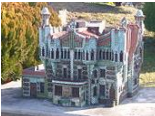
Фиг. 1. Модел на Casa Vicens

Плановете за строителство датират от 15 януари 1883 г. Къщата е изградена от необработен камък, груби червени тухли и е облицована с цветни керамични плочки, подредени в шахматен ред, както и множество плочки с флорални изображения (фиг. 1). Покривът на Casa Vicens е наклонен на две страни и има четири фронтона. Характерна черта в работата на Гауди са решенията за вентилационните тръби и комини, сложно декорирани в подобен на фасадата стил, които добавят драматичен и фантастичен облик на сградата.