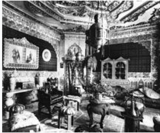
Фиг. 2. Интериор Casa Vicens