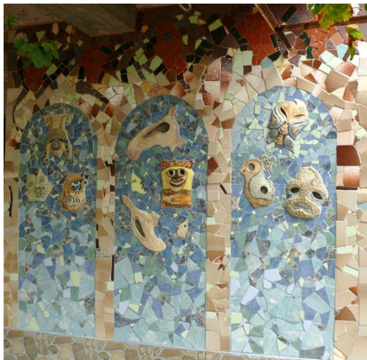
Фиг. 7. Мозайката

Идеята в бъдеще е мозайката да продължи по протежение на цялата фасада с още една арка и три маски, които остава да се включат в общото решение, като се използват същите художествени принципи и материали.