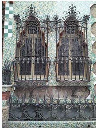
Фиг. 3. Екстериор Casa Vicens