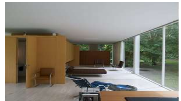
Фиг. 14. Фарнсуорт Хаус (Farnsworth House) е вилна сграда - паметник на културата, проектирана от архитекта Лудвиг Мис ван дер Рое. Къщата е разположена в Плейноу, щат Илинойс, САЩ, югозападно от Чикаго