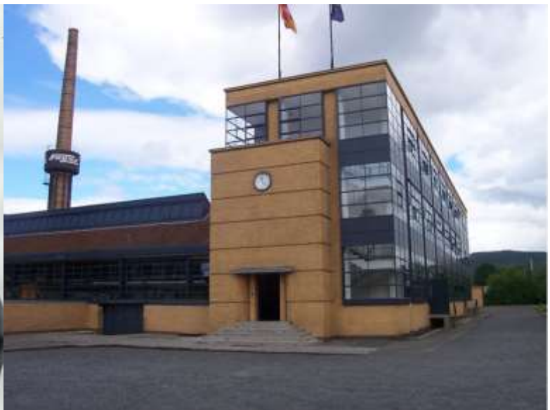
Фиг. 5. Фабриката за общарски калъпи Фагус основополагаща сграда на модернизма (1910 – 1913)