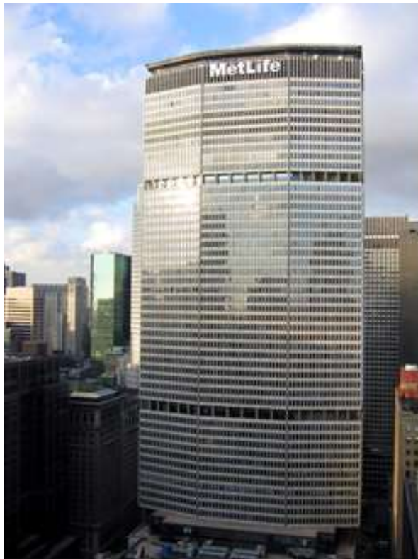
Фиг. 10. Небостъргачът МетЛайф (бивш ПанАм) в Ню Йорк (ТАС 1958 – 1963).