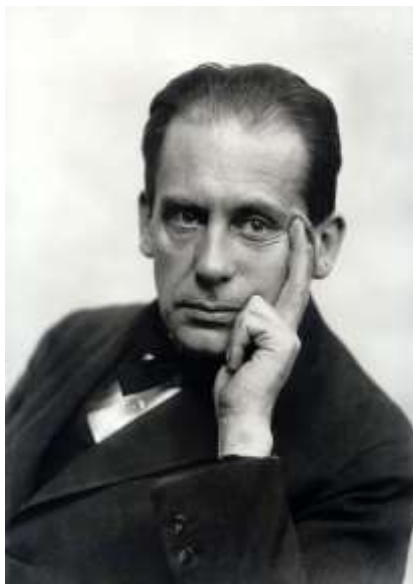
Фиг. 4. Валтер Гропиус около 1920 година

Архитект Валтер Гропиус е роден в 1883 г. в град Берлин, а образованието си по архитектура получава във Висшето техническо училище в Мюнхен и в Берлин.