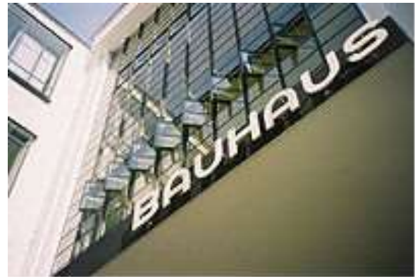
Фиг. 17. Печатницата на Хърбърт Байер - композиция в стил "Баухаус"

Обучението в Баухаус започва не с история на изкуството, а с практични задачи и въвеждане на студентите в базисното формообразуване за да развият те усет към пространството. Учат се и се анализират материали, цветове, повърхности, текстури, печатна графика, скулптура, взаимоотношения между елементите, обработка на стъкло, керамика, метал, текстил, и т.н. Училището е повлияно най-много от неговите трима директори – визионерът Валтер Гропиус (1919 – 1928), комунистът Ханес Майер (1928 – 1930) и професионалистът Мис ван дер Рое (1930 – 1933), но и от силното влияние на много други преподаватели и студенти, сред които Йоханес Итен, Паул Клее, Василий Кандински, Оскар Шлемер, Ласло Махоли-Наги, Йозеф и Ани Алберс, Мариане Бранд, Марсел Бройер - носители на революционно нов, масов и ефективен дизайн, който да прави живота на хората модерен и удобен.