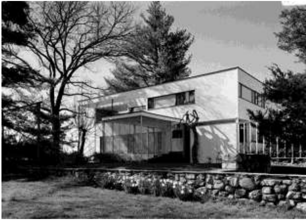
Фиг. 8. Гропиус хаус (1938) в Линкълн, Масачузетс