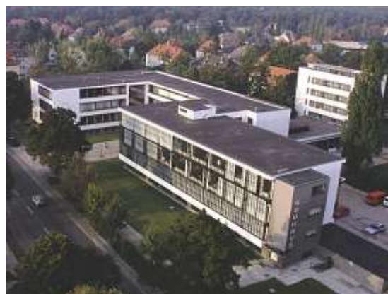
Фиг. 7. Училището Баухаус в Десау /1925-1932г./