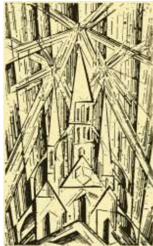
Фиг. 12. “Катедралата“, титулна страница на манифеста на „Баухаус“ (гравюра на Лайнъл Файнингер)

Архитект Мис ван де Рое е роден 1886г. в Аахен, Германия. Първоначално работи в каменоделско ателие на баща си и в дизайнерски фирми, преди да се премести в Берлин, където се присъединява към офиса на интериорния дизайнер Бруно Пол. Той започва архитектурната си кариера, чиракувайки заедно с Валтер Гропиус и Корбюзие в ателието на Петер Беренс, където възприема новите стилкови идеи на модерната култура. Въпреки формалната липса на съответното академично образование той започва с проектирането на фамилни къщи за богатите класови прослойки на германското общество в изчистен неокласически стил в традицията на прочутия пруски архитект от началото на XIX век – Карл Фридрих Шинкел, отхвърляйки широко разпространените по това време еkleктични движения.