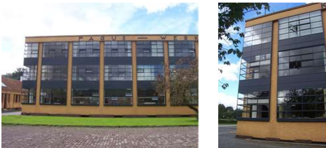
Фиг. 6. С дизайна на фасадата е онагледен основният принцип в модерната архитектура от началото на 20 век – „Формата следва функцията“

През 1910 Гропиус основава архитектурна фирма заедно с Адолф Майер в Нойбабелсберг и става член на Немския индустриален съюз /WERKBUND/. Той подкрепя идеите на Анри ван де Велде, който впоследствие ще го предложи за първи директор на Баухаус. След Първата световна война Гропиус приема необходимостта от стандартизация в дизайна и поставя този принцип в “Баухаус”- Ваймар. Той акцентира върху единството на изкуствата и пропагандира създаването на система от ателиета, ръководени от “майстори”. Конструкцията от бетон, стомана и стъкло става символ на модерното движение в архитектурата. Когато училището се премества в Десау в подхода към дизайна навлиза новия рационализъм и през 1925г. Гропиус проектира новата сграда на училището в съответствие с постиженията в индустрията. През 1934, след закриването на Баухаус от хитлеристите, той емигрира във Великобритания, където сътрудничи на архитекта Максвел Фрай. През 1937г. заминава за САЩ, където на 54 годишна възраст става преподавател по архитектура в Харвардския университет. Гропиус умира през 1969 в Бостън на 86 години.