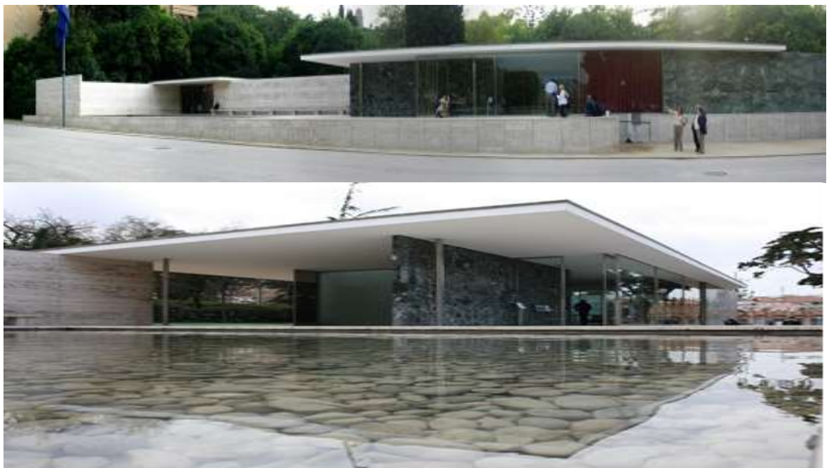
Фиг. 13. Изображения на павилиона в Барселона от Мис ван де Рое Заедно с Валтер Гропиус и Льо Корбюзие, Мис ван де Рое е един от пионерите и майсторите на модернизма. Той е третият и последен ръководител на

Архитект Мис ван де Рое е роден 1886г. в Аахен, Германия. Първоначално работи в каменоделско ателие на баща си и в дизайнерски фирми, преди да се премести в Берлин, където се присъединява към офиса на интериорния дизайнер Бруно Пол. Той започва архитектурната си кариера, чиракувайки заедно с Валтер Гропиус и Корбюзие в ателието на Петер Беренс, където възприема новите стилкови идеи на модерната култура. Въпреки формалната липса на съответното академично образование той започва с проектирането на фамилни къщи за богатите класови прослойки на германското общество в изчистен неокласически стил в традицията на прочутия пруски архитект от началото на XIX век – Карл Фридрих Шинкел, отхвърляйки широко разпространените по това време еkleктични движения.