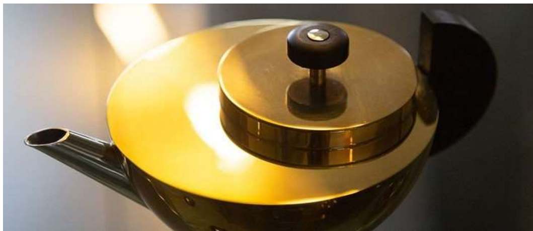
Фиг. 18. Чайник - произведение на Баухаус

Обучението в Баухаус започва не с история на изкуството, а с практични задачи и въвеждане на студентите в базисното формообразуване за да развият те усет към пространството. Учат се и се анализират материали, цветове, повърхности, текстури, печатна графика, скулптура, взаимоотношения между елементите, обработка на стъкло, керамика, метал, текстил, и т.н. Училището е повлияно най-много от неговите трима директори – визионерът Валтер Гропиус (1919 – 1928), комунистът Ханес Майер (1928 – 1930) и професионалистът Мис ван дер Рое (1930 – 1933), но и от силното влияние на много други преподаватели и студенти, сред които Йоханес Итен, Паул Клее, Василий Кандински, Оскар Шлемер, Ласло Махоли-Наги, Йозеф и Ани Алберс, Мариане Бранд, Марсел Бройер - носители на революционно нов, масов и ефективен дизайн, който да прави живота на хората модерен и удобен.