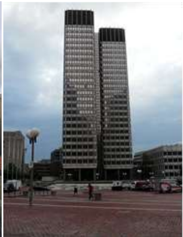
Фиг. 11. Федералната сграда „Джон Ф. Кенеди“ в Бостън (ТАС 1963 – 1966).

Гропиус доразвива идеята за gesamtkunstwerk /тотално изкуство/ и пише манифест на Баухаус, в който призовава „да направим нова гилдия, да изтрием границата между занаятчии и артисти и да създадем сградата на бъдещето, която ще свърже в едно архитектура и изкуство и ще се издигне в небесата, като кристален символ на една нова вяра”. На заглавната страница на манифеста е гравюрата на Лайнел Файнингер “Катедрала на бъдещето” – декомпозирана готическа катедрала сред снопове светлина, в устрем напред и нагоре, увенчана с три звезди.