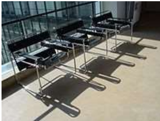
Фиг. 16. Столът „Васили“ („Модел В3“) на Марсел Бройър (1925 – 1926)