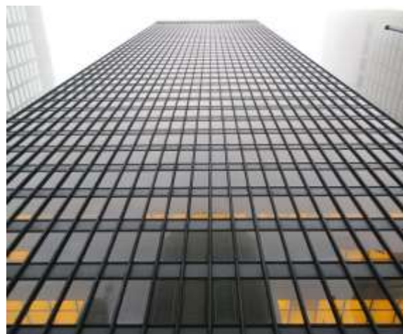
Фиг. 15. Сигрем Билдинг (Seagram Building) е административна сграда – небостъргач, проектиран от архитектите Лудвиг Мис ван дер Рое и Филип Джонсън. Парк Авеню в Манхатан, Ню Йорк, с височина 157 метра в 38 етажа, 1954 – 58 г.